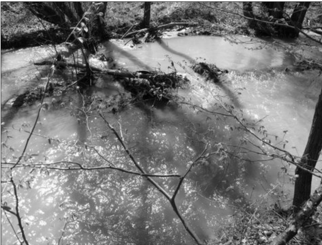
Amikor a patak az úr...

alkalommal árasztotta el a községet a víz, és okozott hatalmas kárt, 1894-ben és 1999-ben. Bár hozzá kell tenni, hogy a katasztrófa közvetlen előidézője mindkét esetben az emberi beavatkozás volt.