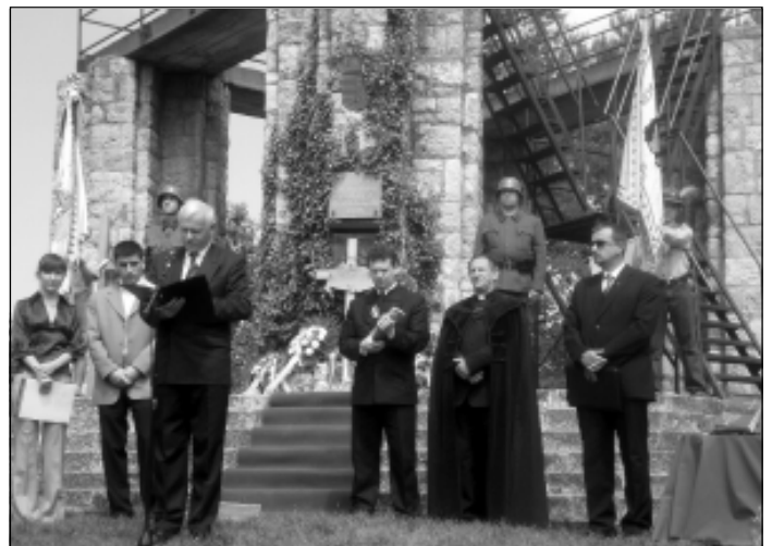
Az elszakított országrészek képviselői