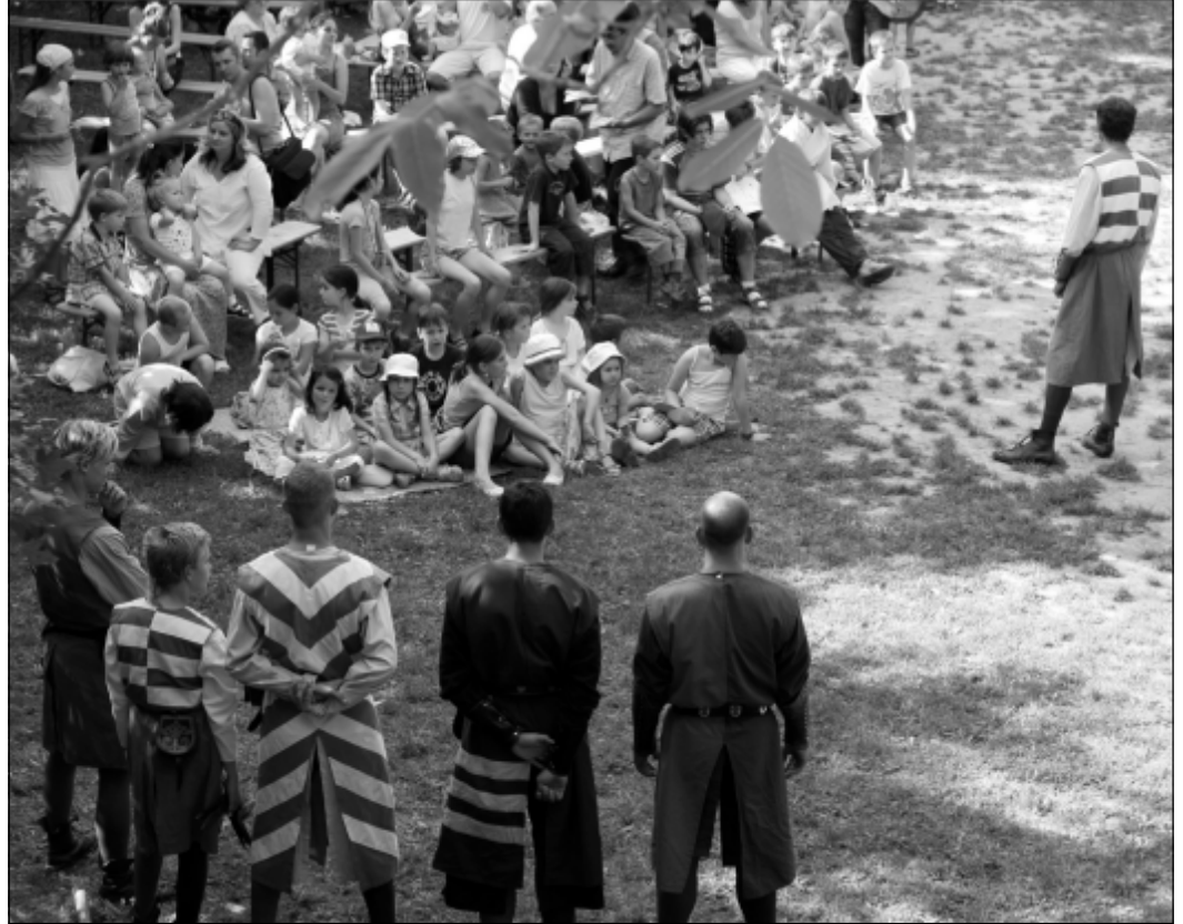
A Visegrádi Szent György lovagrend lovagjai bemutatót tartanak

tartanak, az estét pedig a Vágtázó Csodaszarvas rendező koncertje koronázza meg. A Szőnyi Múzeum vetítőtermében kiállítás nyílik