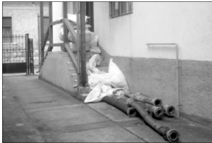
Készülékben a homokzsákok a polgármesteri hivatal előtt

dekezni próbálunk, és közben történik valami visszafordíthatatlan ugyanúgy a polgármesteré, mint ha elmulasztjuk a minimális segítség nyújtást, vagy a lehetetlenség határát súroló mentési munkálatok elvégzését.