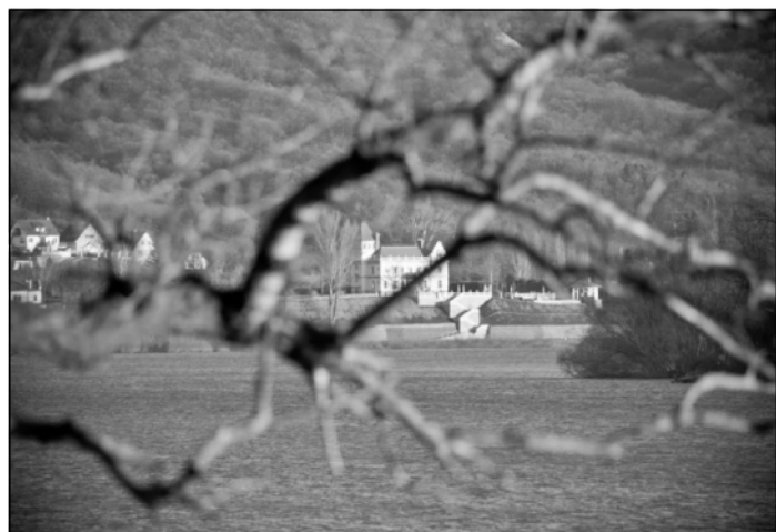
III. helyezett Zebegény Szobról nézve - Weisz Judit