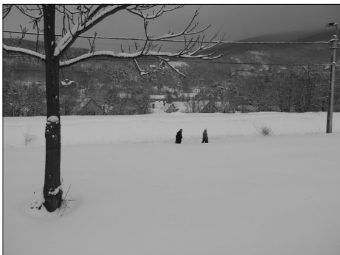
II. helyezett: Zebegényi tél Zebegény - Berczky Bence