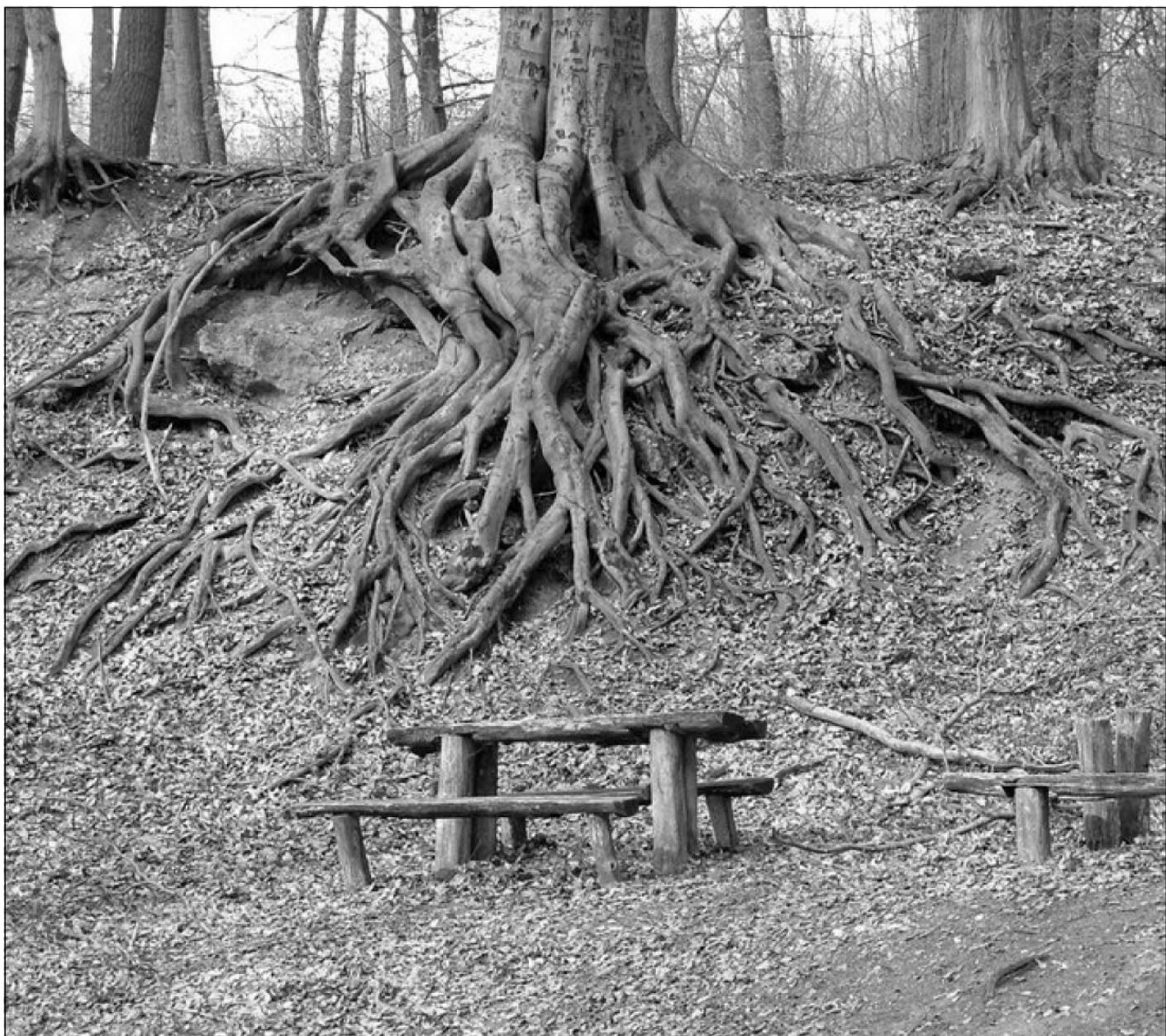
I. helyezett: Hosszú élet fa - Fodor Nóra