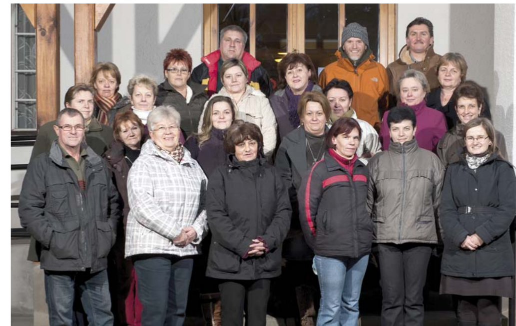
BÉKÉS KARÁCSONYT ÉS BOLDOG ÚJÉVET KÍVÁNNAK AZ ÖNKORMÁNYZAT DOLGOZÓI ÉS A KÉPVISELŐTESTÜLET!