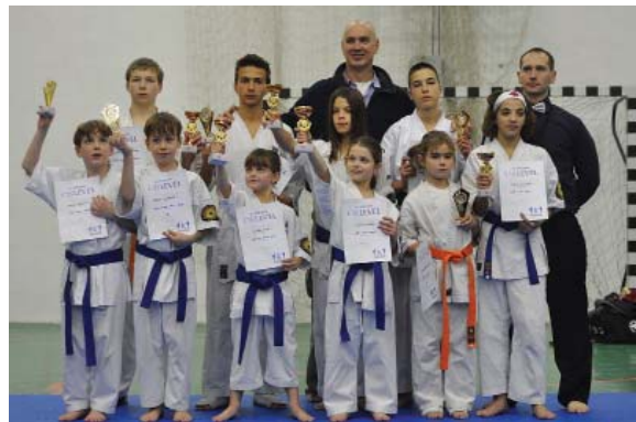
A ZEBEGÉNYI KARATECSOPORT