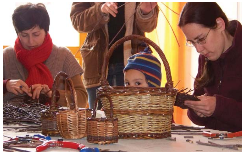
AZ ELKÉSZÜLT KOSARAK

Húsvét előtt járván elsősorban asztali kínáló kosarak és kisebb egyfűlű kézi kosarak készültek, amelyekbe a húsvéti hímes tojások kerültek. A szervezők, a nagy sikerre való tekintettel jövőre is tervezik a program megrendezését.