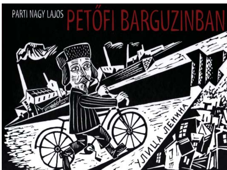
A BORDA ANTIKVÁRIUM HARMADIK SZÉPIRODALMI KIADVÁNYA