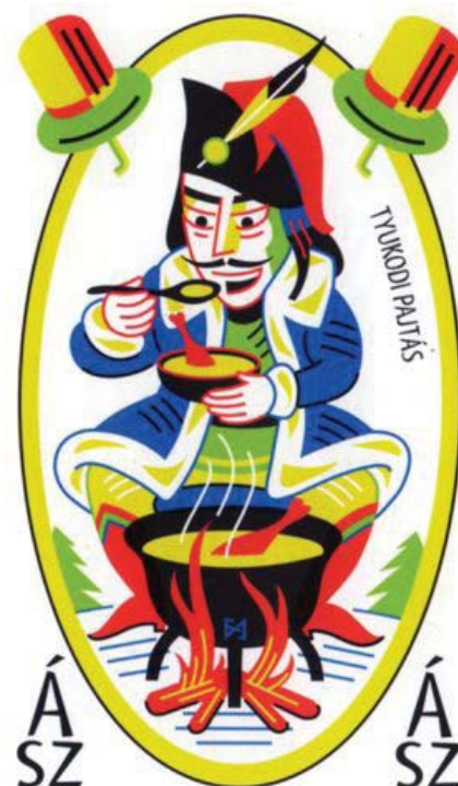
RÁKÓCZI KÁRTYA TERVEZTE: FELVIDÉKI ANDRÁS