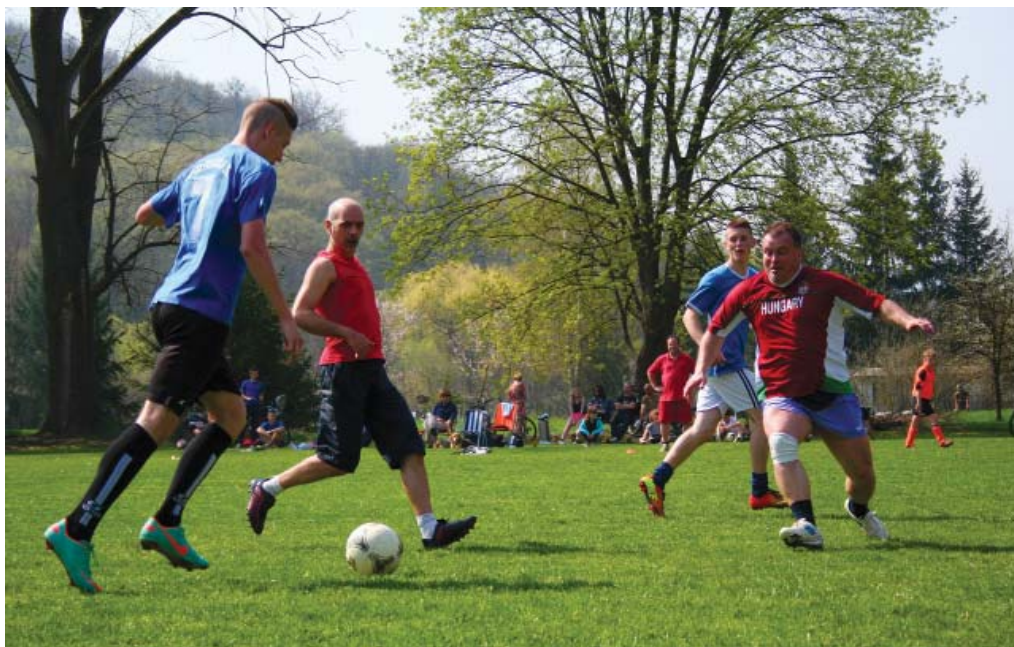
A LEGFIATALABBAK A LEGIDŐSEBBEK ELLEN

A körbeverésnek köszönhetően a gólarány döntött, így a képzeletbeli dobogó legfelső fokát az „U19”-es csapat érdemelte ki, másodikak lettek a kicsit idősebbek, a bronzérmeket pedig a legidősebbek vihették haza. Miután az utolsó mérkőzés is lezajlott, jó volt látni, hogy a résztvevők nem szétszéledtek, hanem együtt maradtak a padoknál, és jó hangulatban megbeszéltek az asznapi eseményeket. Folytatás május elsején, a nős-nőtlen mérkőzésen, szintén a sportpályán!