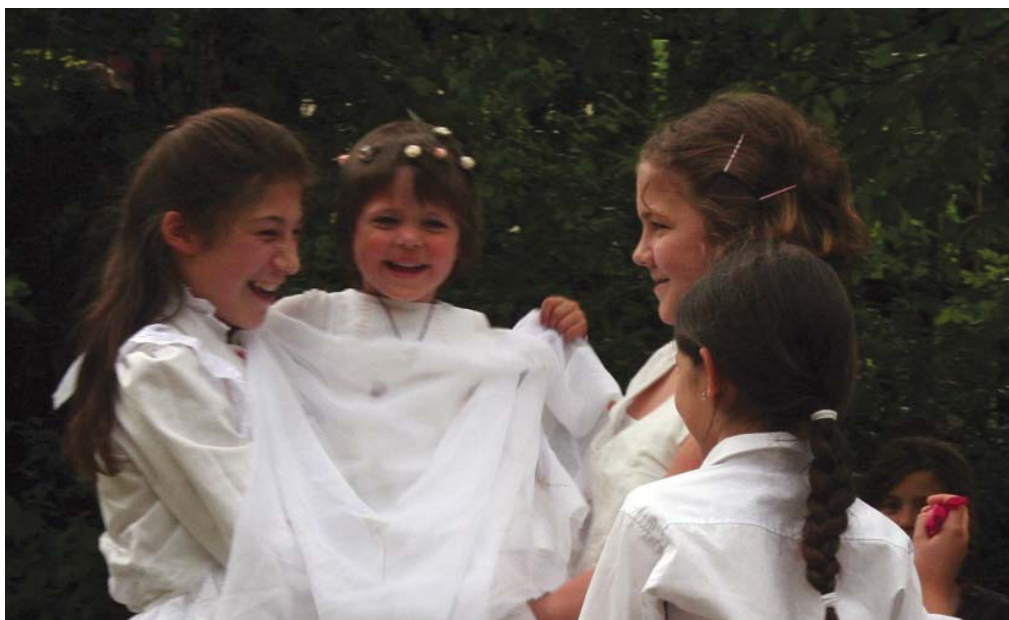
PÜNKÖSDI KIRÁLYNÉ VÁLASZTÁS

Orbán a szőlőtermesztők, kádárok, kocsmárosok patrónusa. Az Orbán-napi hideg a szőlőnek árt legjobban, ezért sokféle szobrot emeltek számára a szőlőben.