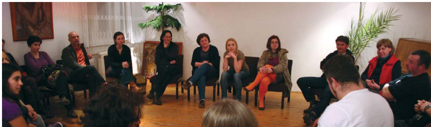
NAGY VOLT AZ ÉRDEKLŐDÉS A TÉMÁVAL KAPCSOLATBAN

Mindezekon túl azonban az is fontos, hogy a kapott lendületet egyénként, kiskerttulajdonosként, vásárlóként, vidéken élőként magunk is továbbvisszük-e, s a fejünkben megszületett ötleteket, megismert lehetőségeket átültetjük-e saját hétköznapijainkba?