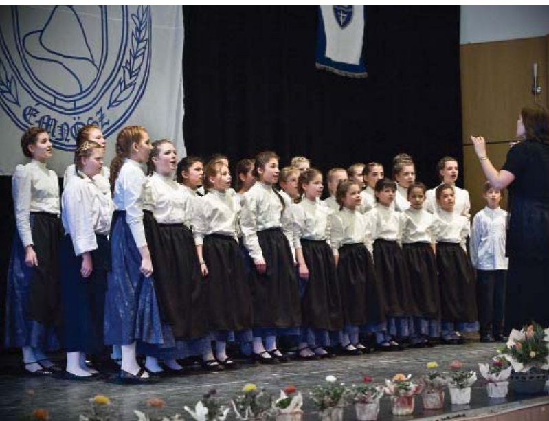
A MEGMÉRETTETÉS PILLANATA