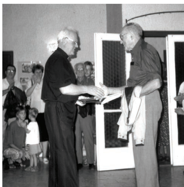
Várhatóan karácsonyra jelenik meg a „Zebegényiek kényszermunkán a Szovjetunióban 1945-47-ben” c. könyv második kiadása.

Zebegény Német Nemzetiségi Önkormányzat Képviselő-testülete a vagyonáról, a vagyonhasznosítás rendjéről és a vagyontárgyak feletti tulajdonosi jogok gyakorlásának szabályairól szóló rendelkezéseit elfogadta.