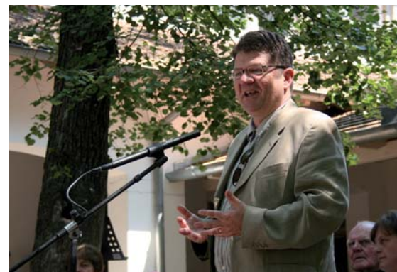
Aáry-Tamás Lajos az oktatási jogok biztosa