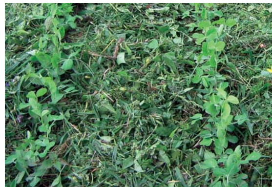
A sorközöket a levágott fű védi