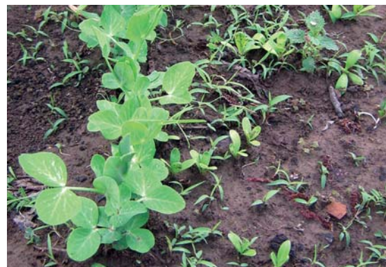
A kikelt borsóval temérdek gyomnövény vetekszik