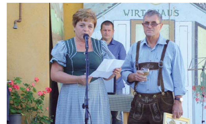
ZEBEGÉNY KÉPVISELŐI GERESDLAKON

dó, szorgalmas, rendezett, festői, vendégszerető, csodás, titokzatos, tiszta. A „geresdlaki feeling” maga a titok. Ezt látni kell, érezni a csodát! Itt kell lenni! Köszönjük ezt az ismeretséget és barátságot a polgármester úrnak és kedves feleségének! Kedves geresdlaki barátaink a tökfesztiválon is megtiszteltek bennünket részvételükkel.