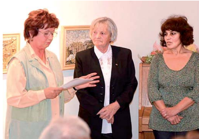
A KIÁLLÍTÁS MEGNYITÓJÁN