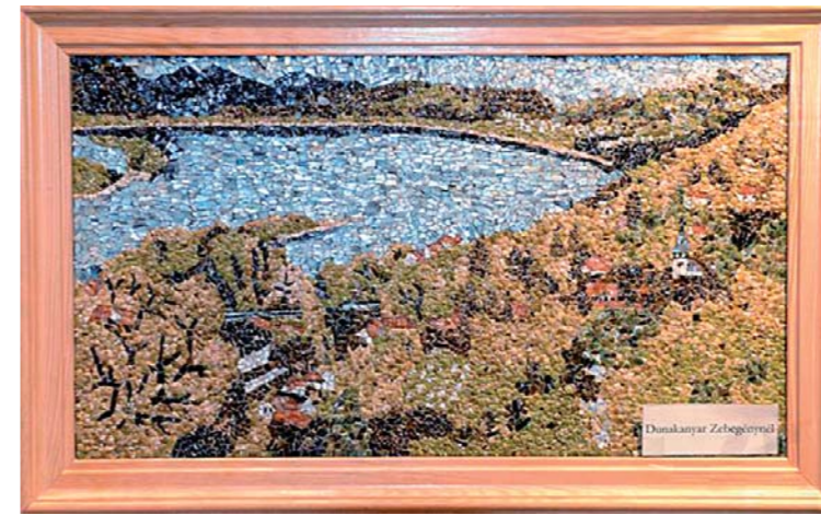
A DUNAKANYAR, AZ EGYIK LEGFONTOSABB TÉMA

Egy időben sokat morfondíroztam azon, mit lehetne zebegényi anyagból készíteni. Olyasvalamit szerettem volna alkotni, ami – mind témájában, mind alapanyagában