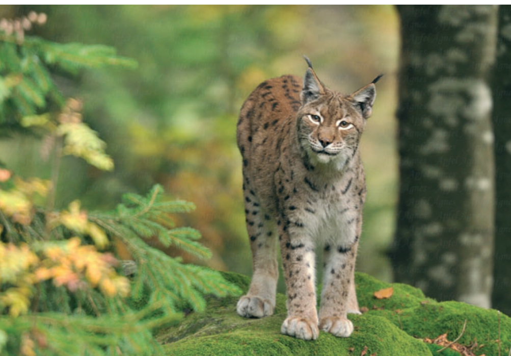
APFEL ÁGI: A HIÚZ MOSOLYA