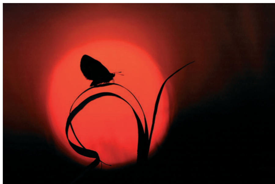
APFEL ÁGI: HAJNAL

Az angolul is megjelenő Természetfotó Magazinban jelentek meg díjnyertes képeim és más fotóim. Több