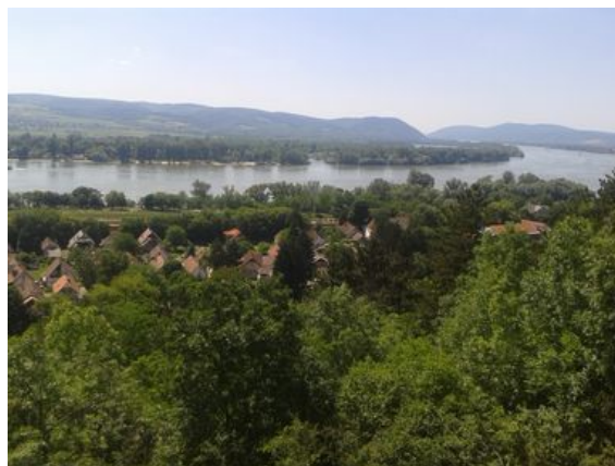
Kilátás a Dunakanyarra

Zebegény táji és domborzati adottságai egyedülállóan változatosak. A hegyvölgyes domborzat, a nagy szintkülönbségek a természetjárás különböző válfajai mellett speciálisan sportolási célokra is hasznosítható. A településen megvan a létjogosultsága edzőtáboroknak, a sportturizmus fejlesztése egy sajátos irányvonal és cél lehet. Ez a fejlesztési irány egy átfogó sportkoncepció keretében kidolgozandó.