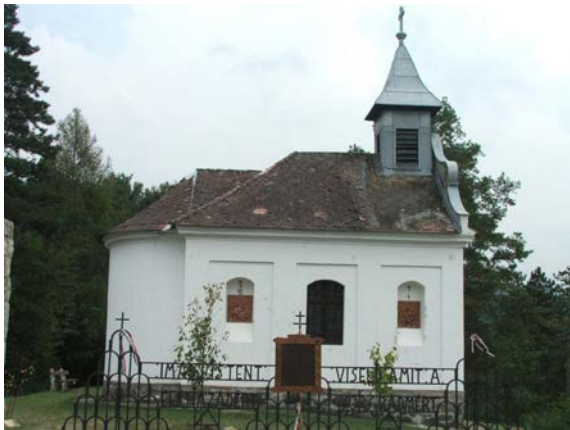
Kápolna a Kálvária dombon