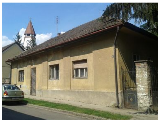
A Mackó ház jelenleg

A projekt célja még, hogy a „Mackó ház”, és a Polgármesteri Hivatal közti zöldfelület rendezvények szervezésére alkalmas parkká váljon, a falu turisztikai „vérkeringésébe” kerüljön, mind közlekedési, mind látogatási célpont szempontjából, valamint helyet biztosítson helyi közösségi funkcióknak is. A bővítés többcélúan rendezvények szervezésének biztosít helyet, a tetőtéri vendégszobák