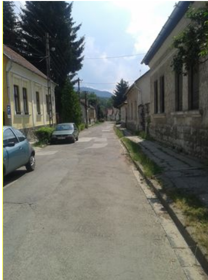
Jellemző utcakép a lakóterületről

A lakásépítésre alkalmas területek - legfeljebb kismértékű - bővítését minden esetben a község intézményi és műszaki infrastruktúra kapacitásaival összehangoltan kell ütemezni.