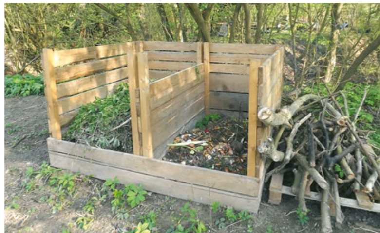
HÁZI KÉSZÍTÉSŰ KOMPOSZTKERET ALMÁSKERTBEN

Hogyan? A komposzt aljára mehet némi ágyesedék, hogy levegőzzön a halom. A kertből és konyhából kikerülő nedves zöld (pl. fűnyesedék, friss